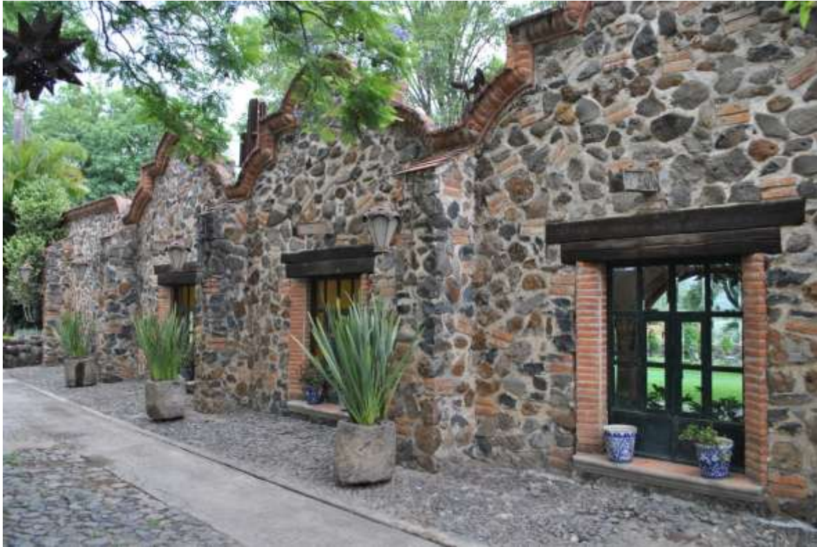
Cortijo Los Fernández