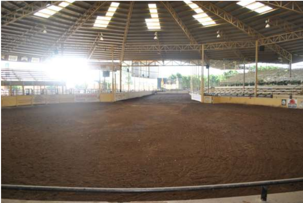
Lienzo Charro Santa María