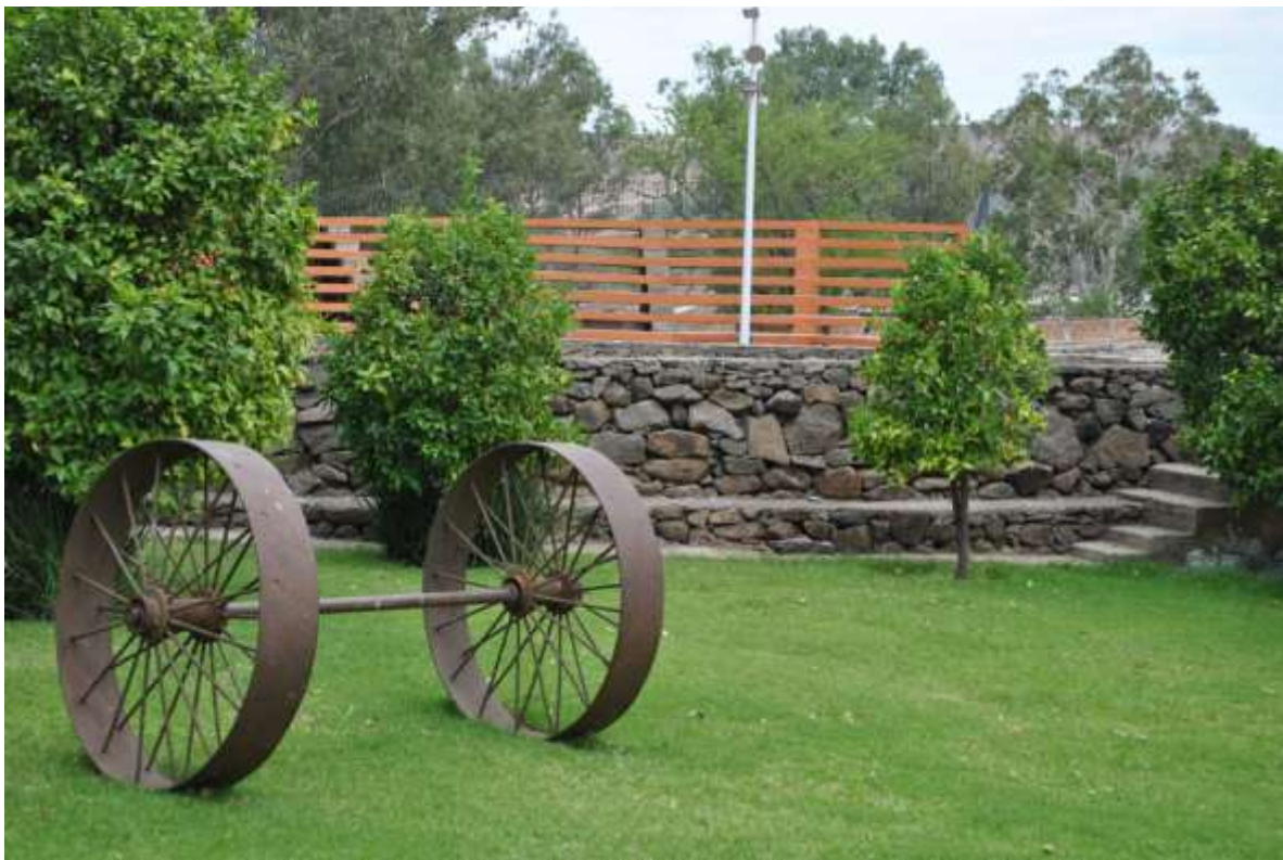
Cortijo Los Fernández