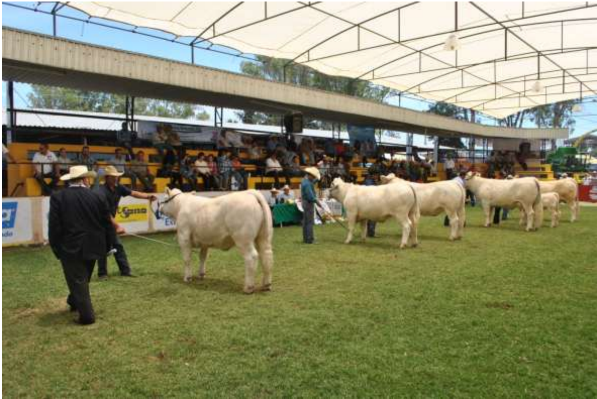
Expo Feria Tepatlán, Jalisco