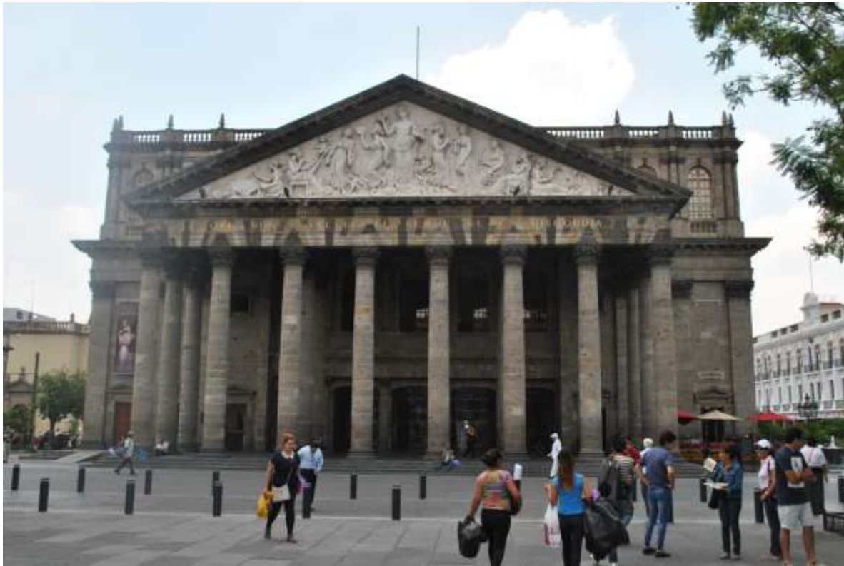
Centro Histórico de Guadalajara