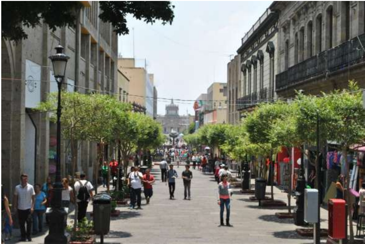
Centro Histórico de Guadalajara