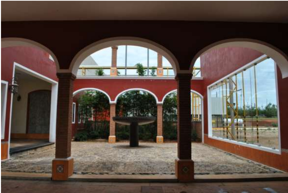
Fabrica de Tequila El Mexicano. Arandas, Jalisco.