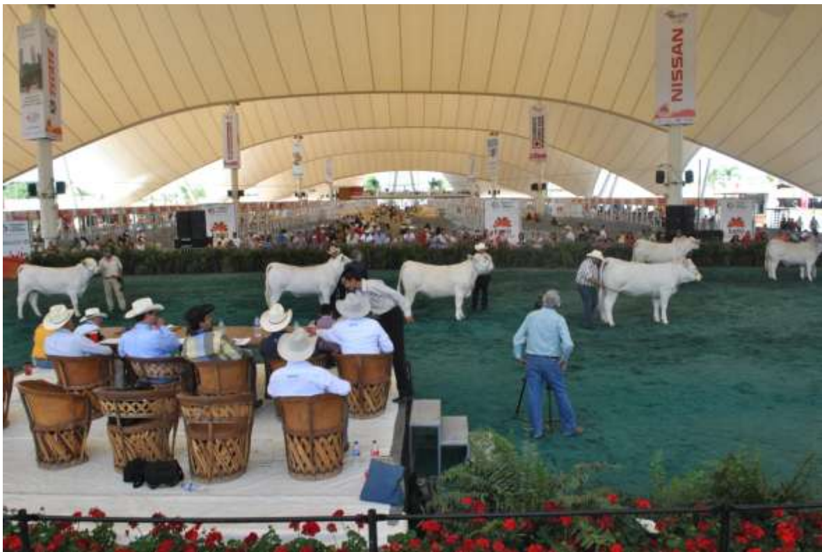
Megavelaria de Aguascalientes