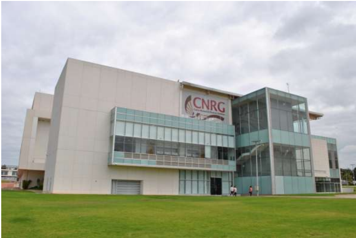
Centro Nacional de Recursos Genéticos. Tepatitlán, Jalisco.