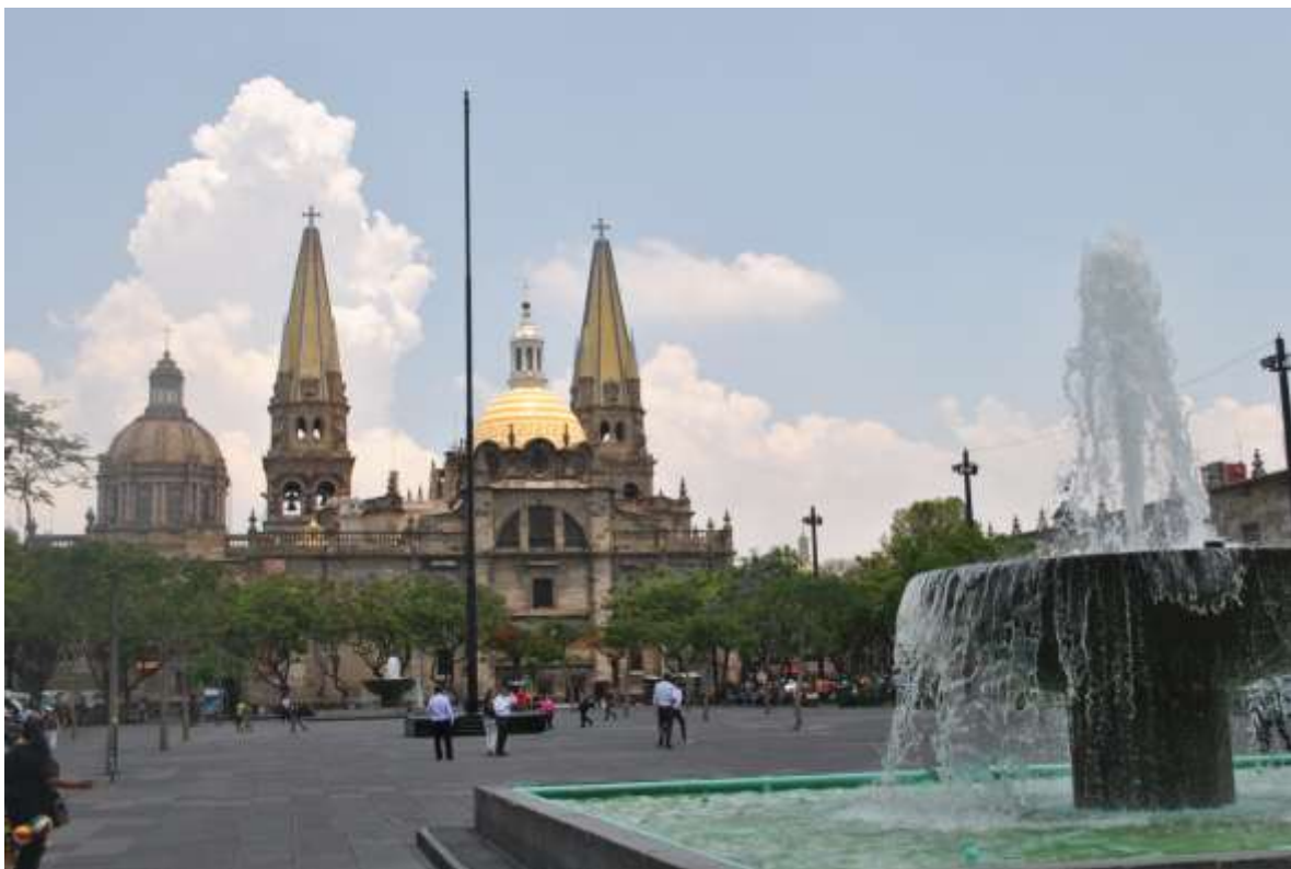
Centro Histórico de Guadalajara

Cabe mencionar que hay un pre congreso que incluye destinos dirigidos a ranchos operantes en distintas partes del país con cupo limitado y para el post congreso destinos turísticos como Puerto Vallarta, Los Cabos y la Riviera Maya, así como también se llevarán a cabo, durante el congreso, las Exposiciones Nacionales de Ganado Charolais y Charbray.