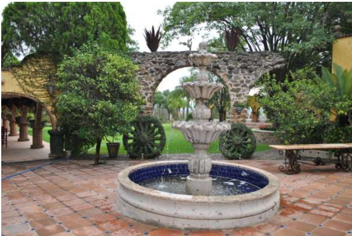
Cortijo Los Fernández