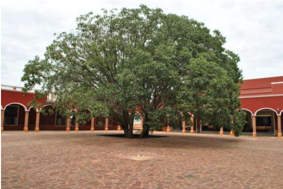
Fabrica de Tequila El Mexicano. Arandas, Jalisco.