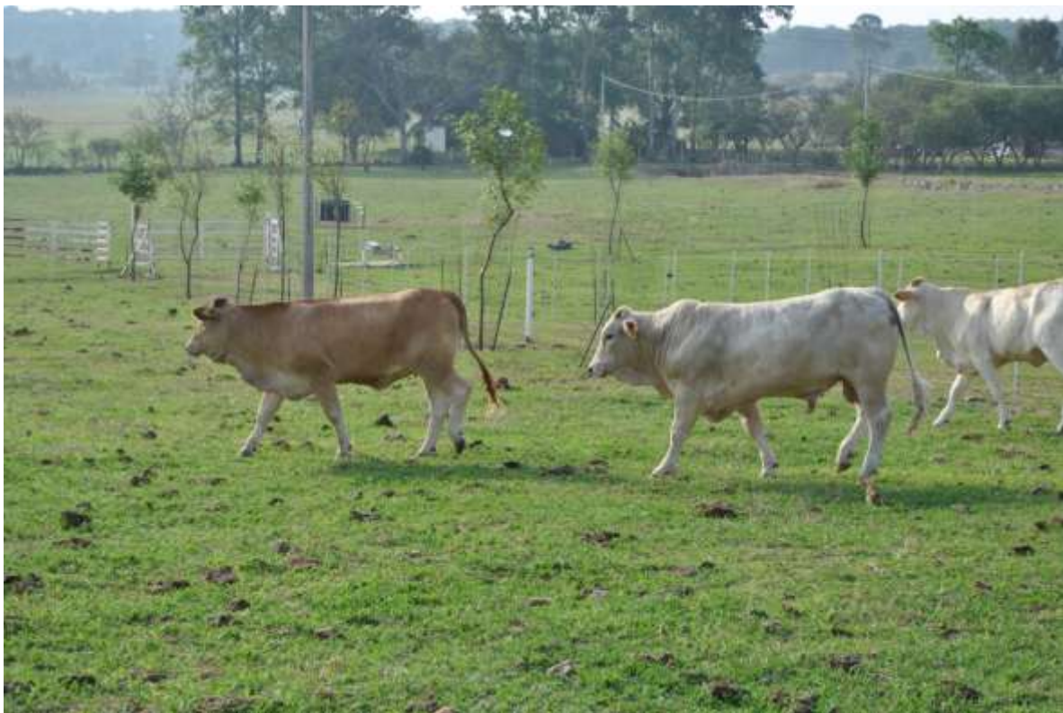
Rancho La Providencia. Ixtlahuacan del Rio.