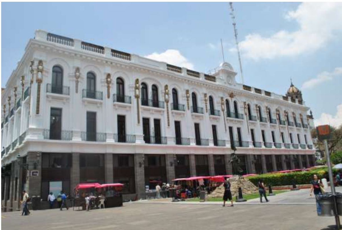
Centro Histórico de Guadalajara